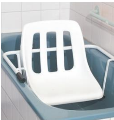
OEP által támogatott termék

Kádra helyezhető ülőke, melynek segítségével a tisztálkodás könnyen elvégezhető. A csőkeret a fürdőkád felső peremére támaszkodik, külön rögzítés nem szükséges.