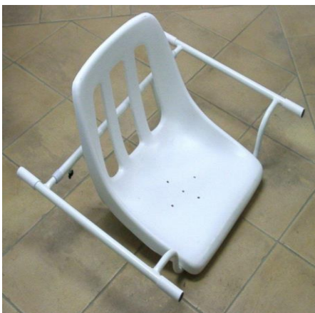
OEP által támogatott termék

A fürdőkád ülőke vázszerkezete vékony falú acélcsőből készül, hegesztett kötésekkel. A vázszerkezet korrózió elleni védelmét ráolvasztott műanyag porlakk bevonat biztosítja. A csővégeket műanyag dugók zárják le. A tapadás növelése céljából, illetve az ülőke és a kád bevonatának védelme érdekében a vázszerkezet felfekvő felületeit műanyag csövek védik. Egy méretben készül, állítható a kádroz. Terhelhetőség 100 kg. A beülő rész műanyag ülőlap. Színeltérés lehetséges.