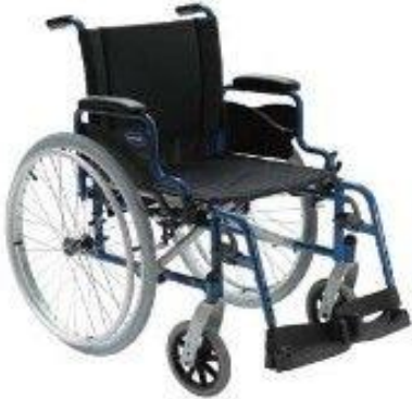
OEP támogatott termék

Kézzel hajtott mechanikus kerekesszék, Ülés mélység: 425 mm, Ülés magasság: állítható 450-500 mm, Beülő szélesség:405 mm, 430mm, 455mm, 480mm, 505mm, kézzel szabályozható fék, normál kartámasz, kartámaszok egyszerűen kivehetőek, standard ülés és háttámla kárpit, fix háttámla, felső lábtartó 80 fokos egyszerűen ki és behajtható, fix lábtányér, első kerék 8"x2" tömör kerék, hátsó kerék 24"x1 3/8 tömör hátsókerék, küllőkkel ellátott, alumínium hajtókarika, vászon lábpánt, fényvisszaverővel ellátott, biztonsági övvel felszerelt, mankótartóval és szerszámokkal felszerelt