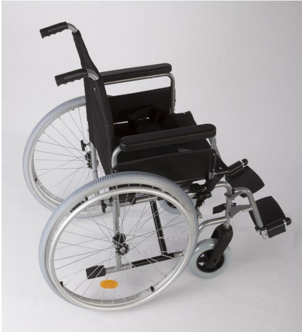
OEP támogatott termék

Acélső vázszerkezetű, színes szinter bevonattal készül műanyag fogantyúkkal. A lábtartók állíthatók, kifordíthatók, leszerelhetők. Egyes alkatrészek krómozottak. Kárpitozása habszivacs betétes, műbőr bevonatú. Lakásban és kisebb távolságra utcán is lehetővé teszi a közlekedést.