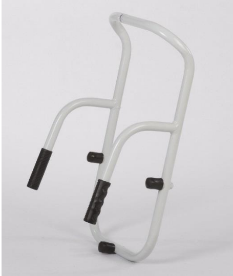
OEP által támogatott termék

Az eszköz csak beépített kádakhoz használható, két konzolos, kerékpár fogantyúval ellátott támasztó karja a kád belső oldalán, a csőkeret alsó részén elhelyezett, csavaros állítású, botvég gumival ellátott három rögzítő tuskó a külső, csempézett oldalon támaszkodik fel. A három külső tuskó megfelelő leszorításával az eszköz megnyugtató módon van rögzítve és így alkalmas a kádba be ill. abból kiszállás megkönnyítésére.