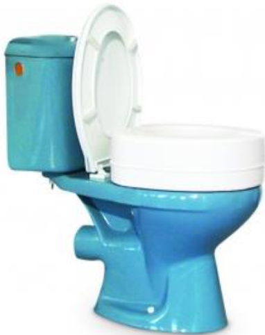
OEP által támogatott termék

A WC magasító olyan mozgásukban korlátozott személyeknek ajánlott, akiknek a leülés illetve a felállás nehézséget okoz. Nagy segítséget nyújt balesetek, tartós vagy átmeneti mozgássérülés, ízületi merevség esetén. Minden szabványos méretű WC kagylóra felhelyezhető, oldalrészén a felülést és leülést segítő kapaszkodók találhatóak. A rögzített WC magasítót a hagyományos WC-nek megfelelően lehet használni. Magassága: 13 cm, Terhelhetősége: 100 Kg