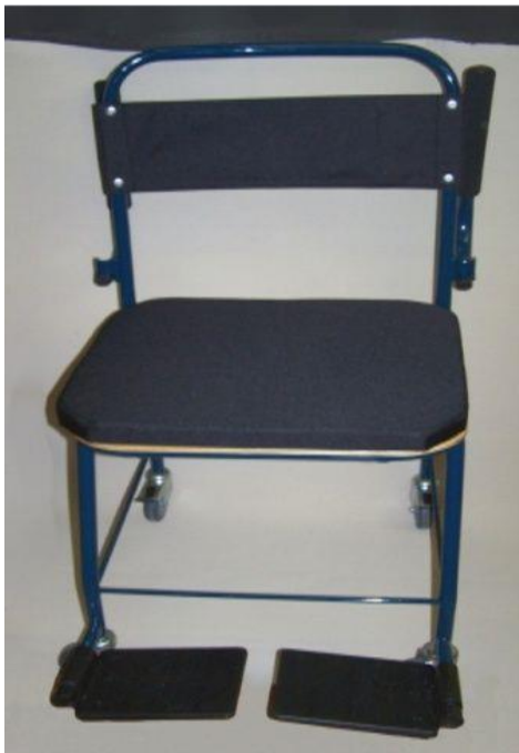
OEP által támogatott termék

A toalett szék vázszerkezete hajlított acélcsőből készül, hegesztési eljárással. A WC ülőlap és hátlap vákuum formázott műanyaglapból áll, amely a vázhoz popszegeccsel van rögzítve. A fedlap kárpitozva kerül felszerelésre. A fedlap alján található két darab csap a WC-lap furataihoz tájolva tartja helyzetben. A kartámasz szivaccsal ellátott, és felhajtható. A WC lap alatti műanyag edény szolgál a vizelet és a széklet gyűjtésére. A műanyag edény a vezetősínen hátracsúsztatva kiemelhető. Kerekei az első kettő önbeálló görgővel van ellátva, a hátsó kettő kerék fékezhető. Az első kerekek fölött lábtartó található. A lábtartók felhajthatóak. Az ülőlap két oldalán található kartámasz lehetővé teszi a kényelmes ülést, melynek felhajthatósága megkönnyíti a beteg áthelyezését. Saját tömeg: 9,6 kg, Magasság: 910 mm, Terhelhetőség: 110 kg Szélesség: 525 mm, Hossza: 455 mm