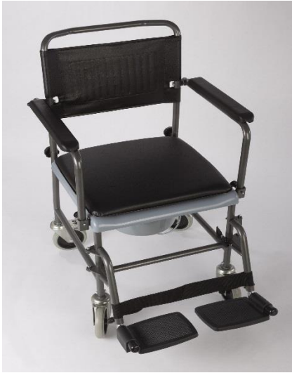
OEP által támogatott termék

Az RS 32 típusú gördíthető, fékes szobai WC hegesztett, merev csőváz szerkezete kemény műanyag szinter bevonatú. A hátsó két bolygókerék lábbal működtethető rögzítő fékkel van felszerelve. A vázszerkezetre esztétikus, víz át nem eresztő műanyag kárpitozású háttámasz és kartartók vannak felszerelve. A vázszerkezetekre az első görgők felett hegesztett csőkonzolokon felhajtható, fröccsöntött műanyag lábtámaszok vannak. A szobai WC a takaró fedél eltávolítása után a már meglévő WC fölé is helyezhető illetve a vödör segítségével a mellékhelyiségen kívül is használható. A görgők a helyváltoztatást segítik elő.