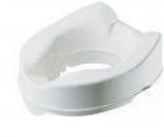
OEP által támogatott termék

A WC magasító olyan mozgásukban korlátozott személyeknek ajánlott, akiknek a leülés illetve a felállás nehézséget okoz. Nagy segítséget nyújt balesetek, tartós vagy átmeneti mozgássérülés, ízületi merevség esetén. Minden szabványos méretű WC kagylóra felhelyezhető, oldalrészén a felülést és leülést segítő kapaszkodók találhatók. A rögzített WC magasítót a hagyományos WC-nek megfelelően lehet használni. Magassága: 13 cm, Terhelhetősége: 100 Kg