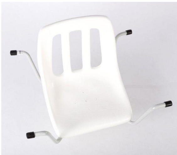
OEP által támogatott termék

Az RS-41 típusú fürdőkád ülőke használata kádban ülve a tisztálkodás kényelmes elvégzését szolgálja. Olyan mozgáskorlátozott betegeknek ajánljuk, akik önellátásra csak segítséggel képesek. RS-41-es fürdőkád ülőke 4 gumikupakkal rögzül a kád pereméhez, a csőkeret pedig a fürdőkád felső peremére támaszkodik. Miután az ülőke szinte megfelel a kád pereme és alja közti távolságot megkönnyíti beülést, illetve a felállást a kádban. Használata során a tisztálkodás egyszerűbbé és biztonságosabbá válik. Tisztítása nedves ruhával és semleges mosószerrel történjen. Maximális terhelhetőség: 90 kg