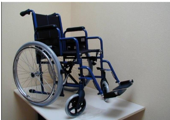
OEP támogatott termék

Azok számára ajánljuk, akik egyszerűen karbantartható, strapabíró, ugyanakkor biztonságos gyógyászati segédeszközt keresnek. A stabil szerkezeti egységek nagy biztonságot nyújtanak a felhasználó számára. Lábtartója könnyen ki-/befordítható, levehető, kartámlája igény szerint kiemelhető, háttámlája pedig kellő megtámasztást biztosít. Nylon kárpitozása könnyen tisztítható. A kísérő számára integrált billenés segítővel látták el mindkét oldalon, amely még könnyebbé teszi a közlekedést. Acélprofil csőváz, Fekete, nylon kárpitozás, Összecukható, szállítható, Stabil, egyszeres keresztvilla, Hagyományos rögzítő fék, Bottartó