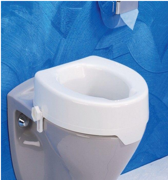
OEP által támogatott termék

Az Easy-Clip olyan stabilan támaszkodik a WC-csészére, mint a felcsavarozott magasítók, egyszersmind ez a rögzítés egyszerű mozdulattal oldható és a magasító leemelhető tisztításnál vagy, ha olyan személy használja a WC-t, akinek erre nincs szüksége. A magasító kb. 10 cm-rel emeli meg a WC peremét, így kerekesszékből történő átülésnél a WC- csésze és a kerekesszék ülés magassága egy síkban van.