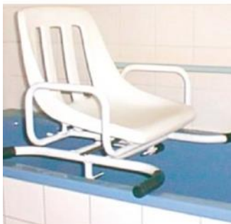
OEP által támogatott termék

Mozgássérültek otthoni használatára, a házi betegfürdetés megkönnyítésére szolgál, de alkalmazható kórházakban, szociális intézményekben is. Segít minden olyan esetben, amikor a beteg ülni és kapaszkodni képes, de a fürdőkádba belépni ill. beülni nem tud.