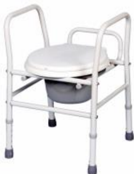
OEP által támogatott termék

Állítható magasságú, hordozható szobai WC, azoknak a betegek, akiknek a vízöblítéses WC ülőke magassága túl alacsony, és a felállás, illetve a leülés nehézséget okoz. Kifejezetten könnyű, praktikus segédeszköz. A WC csésze fölé helyezve magasítóként is használható. Tartálya az ülés alatti sínbe