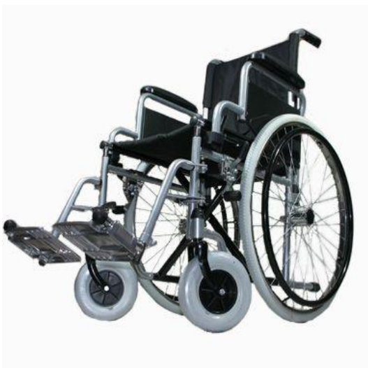
OEP támogatott termék

Könnyen összecukható, tömör gumikkal szerelve, hátsó kerekek kivehetők az egyszerűbb szállítás érdekében, áthelyezhető súlyponttal, kivehető kartámlák a ki és beszállás megkönnyítéséhez, kategóriájának legkönnyebb széke 15,5kg, 120kg-ig terhelhető, 38-tól 51-ig terjedő beülősélesség