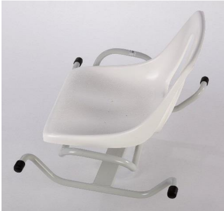
OEP által támogatott termék

Az RS-42 kifordítható fürdőkád ülőke használata kádban ülve a tisztálkodás kényelmes elvégzését szolgálja. Olyan mozgáskorlátozott betegeknek ajánljuk, akik önellátásra csak segítséggel képesek. A termék egy hegesztett acélváz szerkezetre épülő műanyag ülőke, mely a kádba való behelyezés után lehetővé teszi az egyszerűbb ki-be szállást, azáltal hogy a váz a beépített csapágy segítségével körbe forgatható és negyedfordulatonként rögzíthető. Előnye, hogy a beteget nem kell a kádba beemelni, mivel a forgatás során a beteg csak beül az ülőkébe, lábait vízszintbe emeli, s a befordítás, majd lerögzítés után a tisztálkodás könnyen elvégezhető. Maximális terhelhetősége: 90 kg.